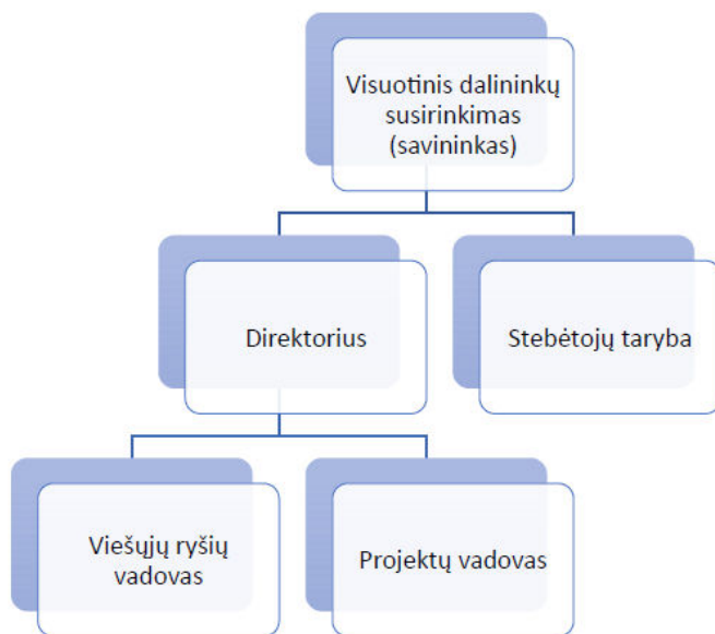
1 pav. Įstaigos valdymo struktūra